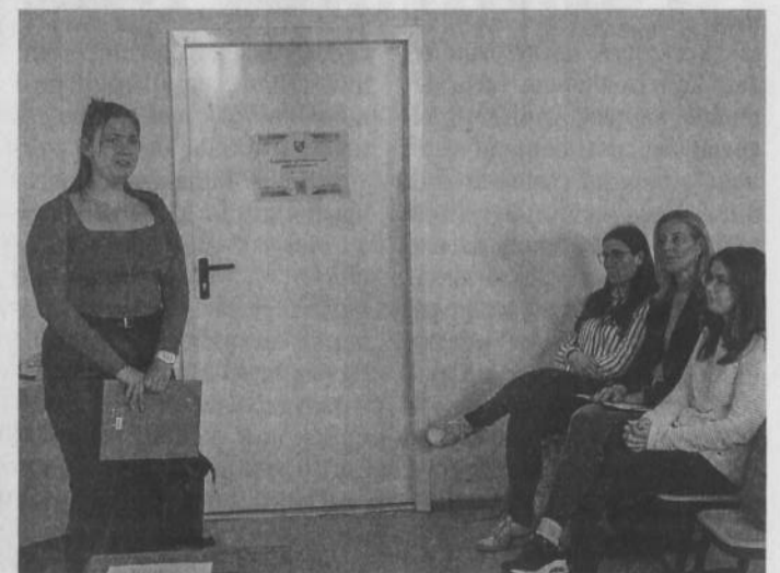
A győzelem közép- vagy felsőfokú nyelvvizsgára predestinál

Az Egererdő Erdészeti Zrt. és az Aktív Magyarország szervezi a természetvédelmi programot